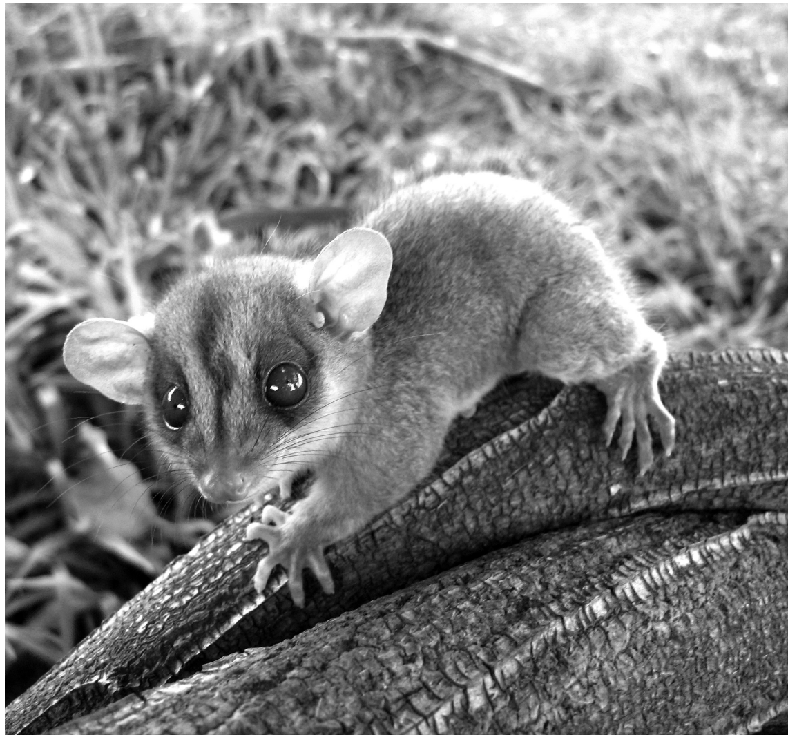
Caluromys philander .