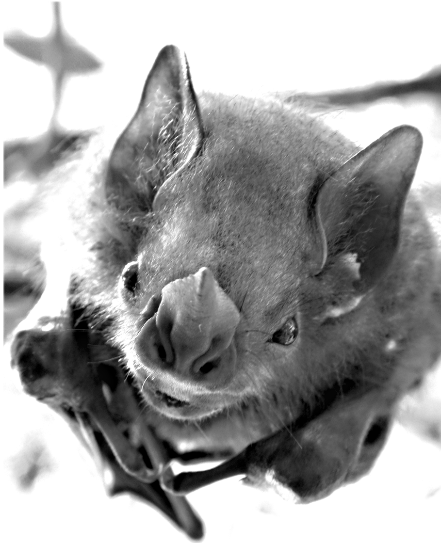
Pygoderma bilabiatum .